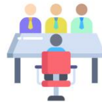
การไต่สวน