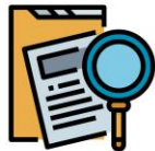
การแสวงหาข้อเท็จจริง