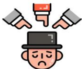
การกล่าวหา