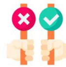
การมีความเห็นหรือวินิจฉัย

ที่ดำเนินการไปโดยชอบอยู่แล้วในวันก่อนวันที่ พ.ร.ป. ป.ป.ช. พ.ศ. ๒๕๖๑ ใช้บังคับ ไม่ว่าคณะกรรมการ ป.ป.ช. จะได้ไต่สวนข้อเท็จจริงและข้อมูลความผิดทางวินัย ก่อนหรือหลังวันที่ พ.ร.ป. ป.ป.ช. พ.ศ. ๒๕๖๑ มีผลใช้บังคับ