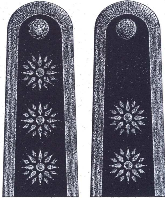
แบบพิเศษ