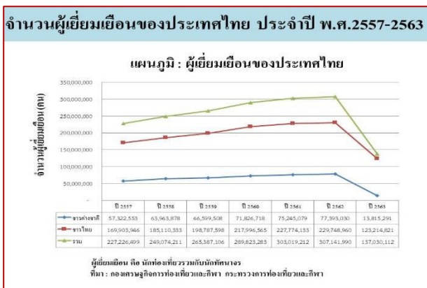
(ภาพที่ 1:จำนวนผู้เยี่ยมเยือนของไทย ปี พ.ศ.2557-2563)

การท่องเที่ยวถือเป็นเครื่องมือ (Tool) และกลไกสำคัญในการขับเคลื่อนฟื้นฟูเศรษฐกิจของประเทศไทย ลำดับต้นๆ โดยเฉพาะในช่วงของสถานการณ์การแพร่ระบาดของโรคติดเชื้อไวรัสโคโรนา 2019 (โควิด-19) อุตสาหกรรมการท่องเที่ยวของประเทศต่างๆ ทั่วโลกได้รับผลกระทบเป็นอย่างมาก ส่งผลต่อการลดทางด้านรายได้ของประเทศ และส่งผลกระทบในวงกว้างต่อผู้ประกอบการ ชุมชนท่องเที่ยว และประชาชน โดยในช่วงก่อนเกิดสถานการณ์โควิด-19 ระหว่างปี พ.ศ. 2557-2562 มีจำนวนผู้เยี่ยมเยือนทั้งชาวไทยและชาวต่างชาติที่เดินทางมาท่องเที่ยวประเทศไทยเพิ่มขึ้นอย่างต่อเนื่อง ขณะที่ในช่วงของวิกฤตโควิด-19 ในปี พ.ศ. 2563 พบว่า จำนวนผู้เยี่ยมเยือนทั้งชาวไทยและชาวต่างชาติลดลงกว่าครึ่งจากปี พ.ศ. 2562 ถึงร้อยละ -55.39 สำหรับด้านรายได้จากการท่องเที่ยวของปี พ.ศ. 2557-2562 ก่อนเกิดวิกฤตโควิด-19 นั้น พบว่า มีจำนวนรายได้เพิ่มขึ้นต่อเนื่องทุกปีจนถึงปี พ.ศ. 2562 และรายได้หดตัวลงเนื่องจากวิกฤตโควิด-19 ในปี พ.ศ. 2563 (จำนวนรายได้จากการท่องเที่ยวและจำนวนผู้เยี่ยมเยือนของประเทศไทย ปี พ.ศ.2557-2563 ดังภาพที่ 1-2)