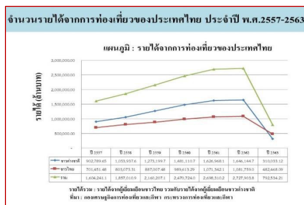
(ภาพที่ 2 จำนวนรายได้จากการท่องเที่ยวของไทยปี พ.ศ.2557-2563)

นอกจากนี้ ผลิตภัณฑ์มวลรวมของประเทศไทย (GDP) ในปี พ.ศ. 2562 เศรษฐกิจของประเทศไทยพึ่งพาอุตสาหกรรมท่องเที่ยวสูงถึงร้อยละ 17.79 แม้ว่าด้านจำนวนนักท่องเที่ยวไทยและนักท่องเที่ยวต่างชาติ และด้านรายได้จากนักท่องเที่ยวไทยและนักท่องเที่ยวต่างชาติจะลดลงในปี พ.ศ. 2563 จากวิกฤตโควิด-19 ก็ตาม แต่จากข้อมูลของกระทรวงการท่องเที่ยวและกีฬา พบว่า ในด้านของรายได้จากนักท่องเที่ยวต่างชาติจะสูงกว่านักท่องเที่ยวไทยประมาณ 2 เท่า (ภาพที่ 3)