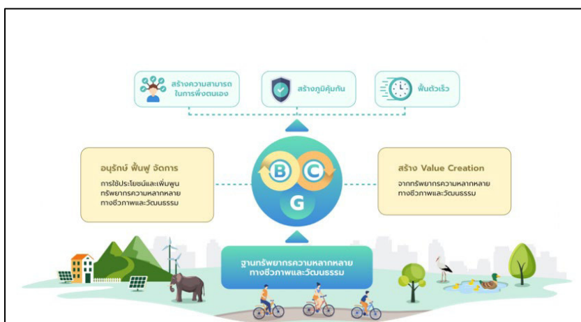
แผนภาพที่ 8 โมเดลเศรษฐกิจ BCG ที่มา: ข้อมูลสำนักงานนโยบายการอุดมศึกษา วิทยาศาสตร์ วิจัยและนวัตกรรมแห่งชาติ (สอวช.) (แผนปฏิบัติการด้านการขับเคลื่อนการพัฒนาประเทศไทยด้วยโมเดลเศรษฐกิจ BCG พ.ศ. 2564-2570)

2.1.3 BCG Model เป็นการพัฒนาเศรษฐกิจแบบองค์รวม ที่จะพัฒนาเศรษฐกิจ 3 มิติไปพร้อมกัน ได้แก่ เศรษฐกิจชีวภาพ (Bioeconomy) ระบบเศรษฐกิจชีวภาพ มุ่งเน้นการใช้ทรัพยากรชีวภาพเพื่อสร้างมูลค่าเพิ่ม โดยเน้นการพัฒนาเป็นผลิตภัณฑ์มูลค่าสูง เชื่อมโยงกับ เศรษฐกิจหมุนเวียน (Circular Economy) คำนึงถึงการนำวัสดุต่าง ๆ กลับมาใช้ประโยชน์ให้มากที่สุด และทั้ง 2 เศรษฐกิจนี้ อยู่ภายใต้เศรษฐกิจสีเขียว (Green Economy) ซึ่งเป็นการพัฒนาเศรษฐกิจที่ไม่ได้มุ่งเน้นเพียงการพัฒนาเศรษฐกิจเท่านั้น แต่ต้องพัฒนาควบคู่ไปกับการพัฒนาสังคมและการรักษาสิ่งแวดล้อมได้อย่างสมดุลให้เกิดความมั่นคงและยั่งยืนไปพร้อมกัน โดยเปลี่ยนข้อได้เปรียบที่ไทยมีจากความหลากหลายทางชีวภาพและวัฒนธรรม ให้เป็นความสามารถในการแข่งขันด้วยนวัตกรรม เพื่อให้เกิดเศรษฐกิจ BCG ที่เติบโต แข่งขันได้ในระดับโลก เกิดการกระจายรายได้ลงสู่ชุมชน ลดความเหลื่อมล้ำ ชุมชนเข้มแข็ง มีความเป็นมิตรกับสิ่งแวดล้อมและการพัฒนาที่ยั่งยืน