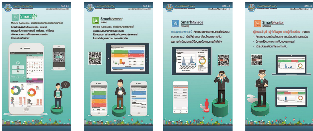
แผนภาพที่ 6 : แสดง Application Smart4M

และความเสี่ยง มีข้อมูลสนับสนุนการตัดสินใจแบบ real – time ซึ่งสามารถเข้าถึงข้อมูลได้อย่างสะดวก ทุกที่ทุกเวลา ผ่านสมาร์ทโฟนหรือแท็บเล็ต ซึ่งข้อมูลที่ได้เป็นข้อมูลที่ช่วยวิเคราะห์ให้ทราบอัตราความเสี่ยงทางการเงินของสหกรณ์ เพื่อจะได้นำไปแก้ไขปรับปรุงการดำเนินงานได้อย่างทันที่ ทำให้ผู้บริหารสหกรณ์สามารถตัดสินใจในการบริหารงานสหกรณ์ได้รวดเร็ว ทันต่อเหตุการณ์และสถานการณ์ที่มีการเปลี่ยนแปลงตลอดเวลา และ 4) Smart Monitor แอปพลิเคชันสำหรับผู้สอบบัญชีสหกรณ์ ผู้กำกับดูแลและหน่วยงานที่เกี่ยวข้อง สามารถติดตามความเคลื่อนไหวและความผิดปกติทางการเงินของสหกรณ์ที่อาจเกิดขึ้น นอกจากนี้ยังมีแอปพลิเคชัน “Smart Auditor” เป็นแหล่งข้อมูลความรู้ที่น่าสนใจให้กับสหกรณ์ กลุ่มเกษตรกร และประชาชนที่สนใจสามารถรับทราบความเคลื่อนไหวได้แบบ real – time รวมถึงประโยชน์ในการสื่อสารเรื่องต่างๆ กับผู้สอบบัญชีด้วย