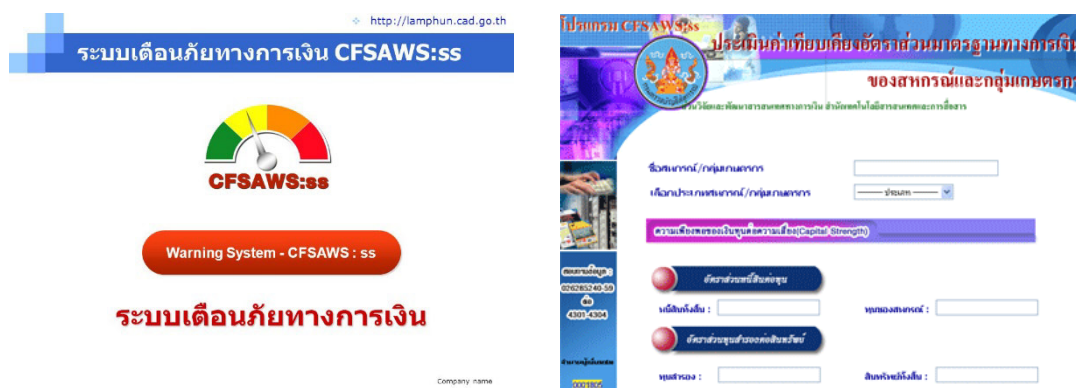
แผนภาพที่ 7 : แสดงโปรแกรมเฝ้าระวังและเตือนภัยทางการเงินของสหกรณ์และกลุ่มเกษตรกร : CFSAWS:ss