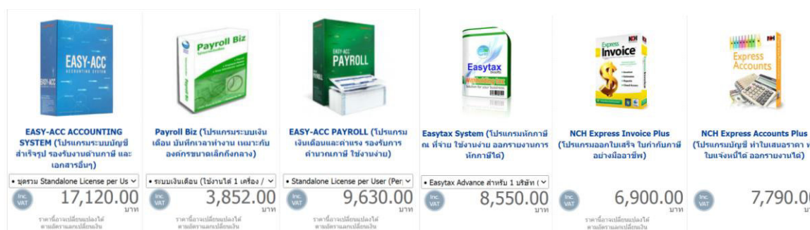
รูปภาพที่ 7 : ตัวอย่างราคา Software บัญชีในท้องตลาด

นอกจากนี้ เครื่องมือที่ใช้ในการจัดทำบัญชีสำหรับผู้ประกอบการ SME ที่เป็นนิติบุคคล เช่น Software บัญชี มีค่าใช้จ่ายต่อเนื่อง ดังนั้น หาก SME ลงทุนซื้อ Software บัญชี เพื่อมาจัดทำบัญชีเองภายในองค์กร จะต้องพิจารณาถึงต้นทุนเหล่านี้ประกอบด้วย รวมถึงมาตรฐานการบัญชีของประเทศไทย มีการเปลี่ยนแปลงอยู่เสมอ และจำเป็นต้องอาศัยบุคลากรที่มีความรู้ ความเชี่ยวชาญ เพื่อให้สามารถจัดทำบัญชีได้ตามมาตรฐานที่เกี่ยวข้องได้ จึงถือเป็นความท้าทายของผู้ประกอบการ SME โดยเฉพาะอย่างยิ่ง SME ตั้งใหม่ซึ่งอาจมีทรัพยากรจำกัด ทั้งในด้านทรัพยากรตัวเงิน และทรัพยากรบุคคล ส่งผลให้ SME ส่วนใหญ่ไม่ได้จัดทำบัญชีเองภายในองค์กร แต่เลือกใช้บริการการจัดทำบัญชีจากผู้ทำบัญชีอิสระ และสำนักงานบัญชีที่กำหนดอัตราค่าบริการต่ำ ซึ่งอาจมีความท้าทายเรื่องคุณภาพของงาน แต่สามารถช่วยประหยัดต้นทุนของ SME ได้