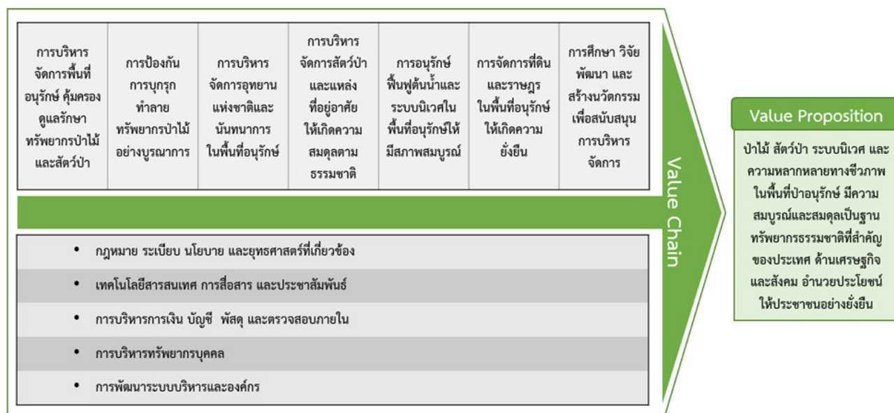
ภาพที่ 4 ห่วงโซ่คุณค่า (Value Chain) กรมอุทยานแห่งชาติ สัตว์ป่า และพันธุ์พืช

โดยมีภารกิจเทคโนโลยี/งานสนับสนุน ได้แก่ กฎหมาย ระเบียบ นโยบาย และยุทธศาสตร์ที่เกี่ยวข้อง/การบริหารการเงิน บัญชี พัสดุ/สารสนเทศ การสื่อสาร และประชาสัมพันธ์ /การตรวจสอบภายใน/การบริหารทรัพยากรบุคคลและการพัฒนาระบบบริหารและองค์กร