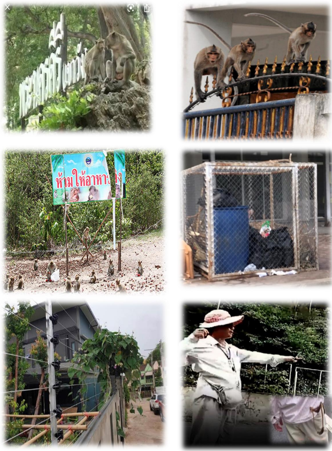
ภาพที่ 1 สภาพปัญหาและวิธีการแก้ไขปัญหาลิงเบื้องต้นของชุมชน