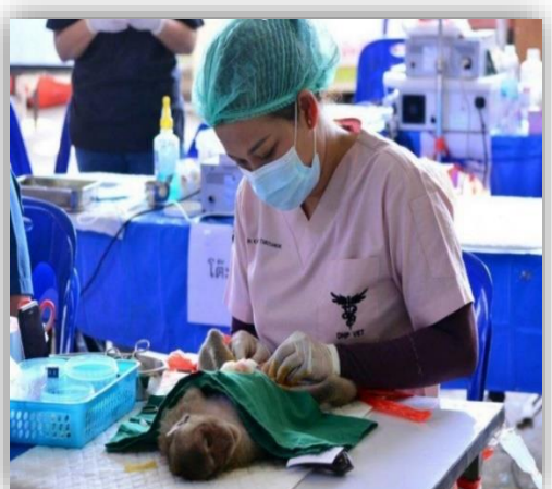
ภาพที่ 2 โครงการการควบคุมประชากรลิง โดยการทำหมัน